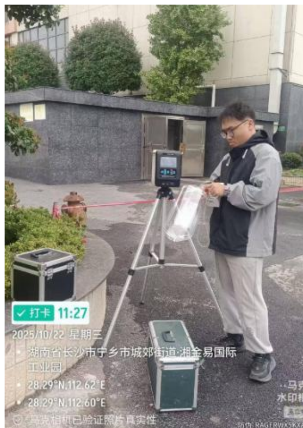
无组织废气监测点 3