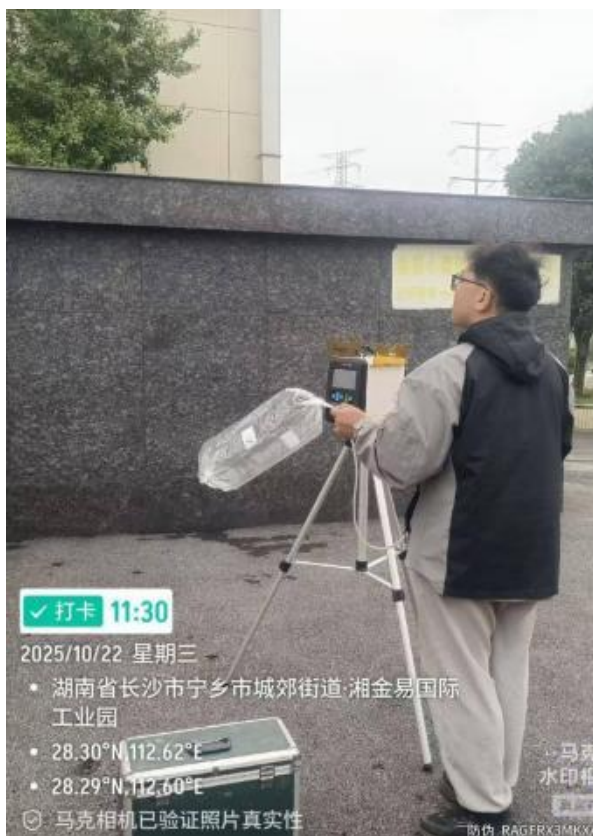
无组织废气监测点 2